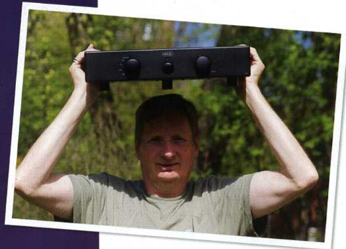
Budsjettredaktøren med en klar vinner.

som prioriterer positivt lydmiljø framfor energikonsum. Herlig utrendy!